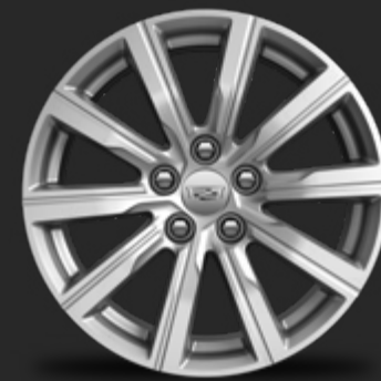
RINES DE ALUMINIO DE 18"