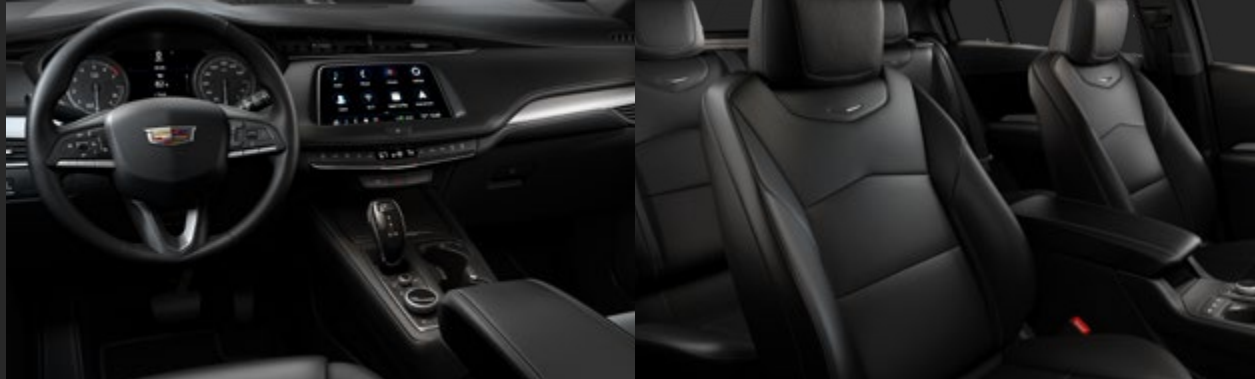
JET BLACK DISPONIBLE EN VERSIÓN PREMIUM LUXURY