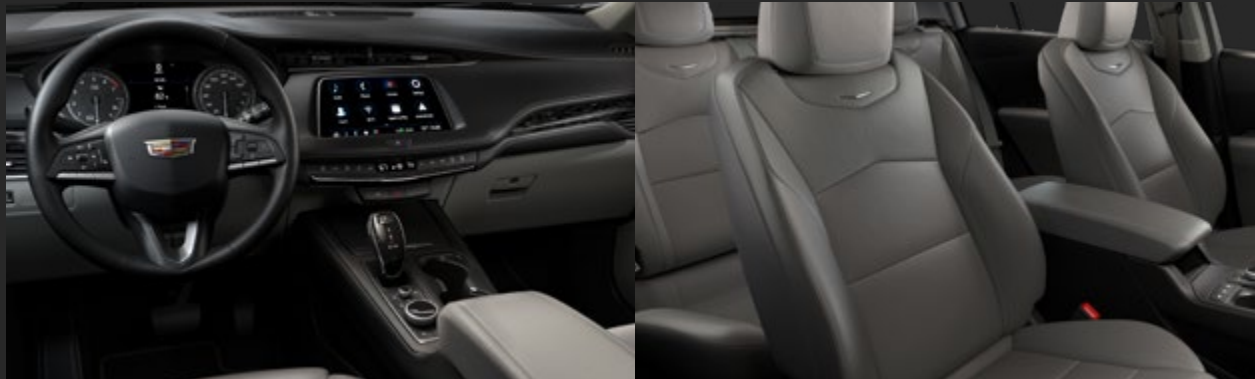
JET BLACK / LIGHT PLATINUM DISPONIBLE EN VERSIÓN PREMIUM LUXURY