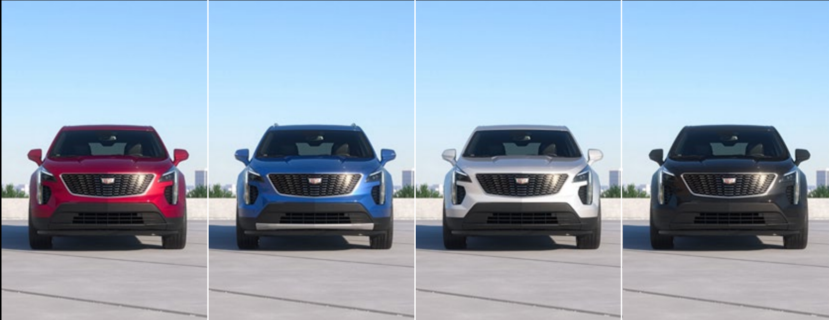
RADIANT RED METALLIC