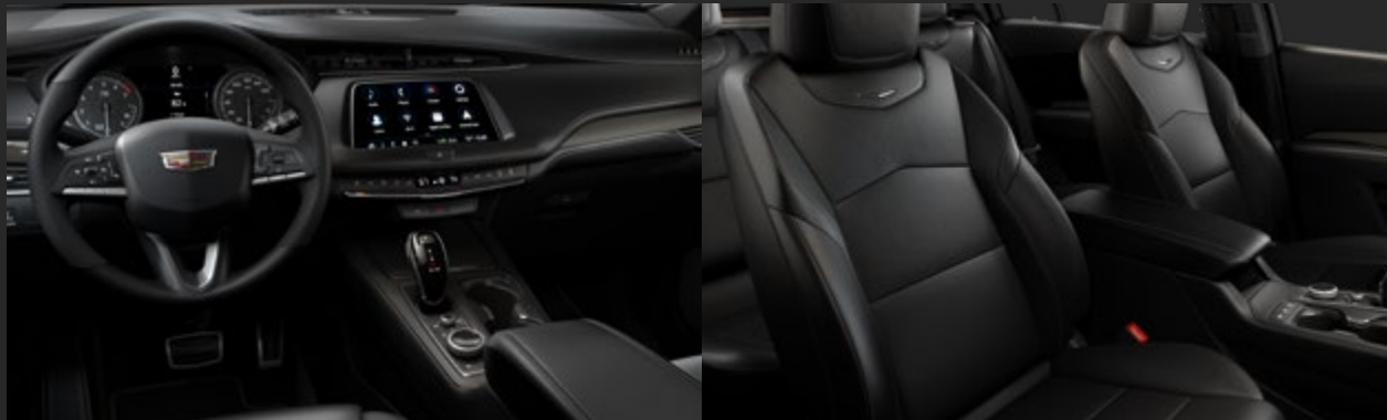
JET BLACK / CINNAMON STITCH DISPONIBLE EN VERSIÓN SPORT