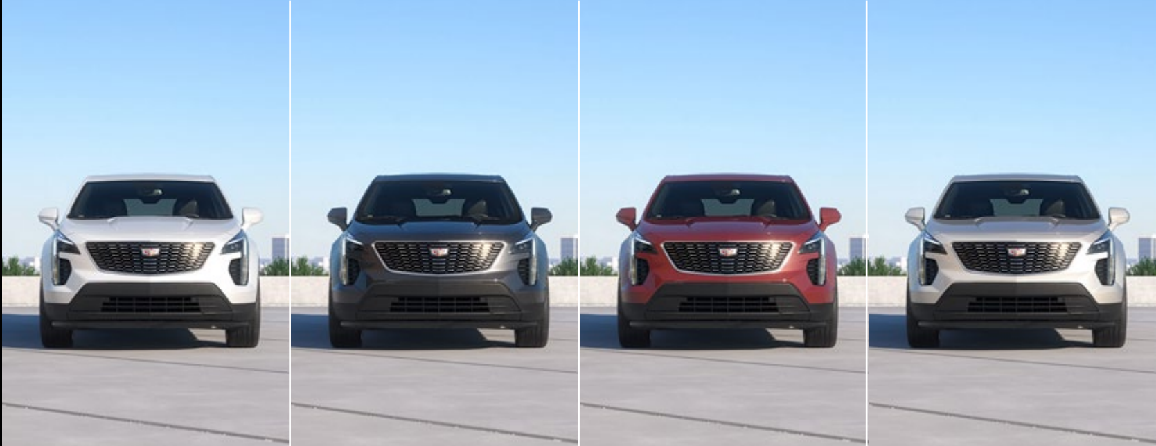
ABALONE WHITE TRICOAT