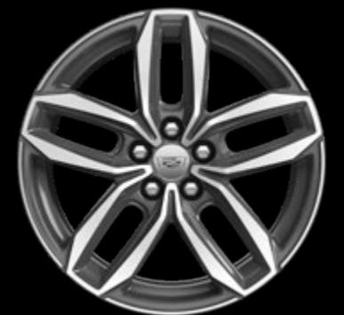
RINES DE ALUMINIO DE 20"